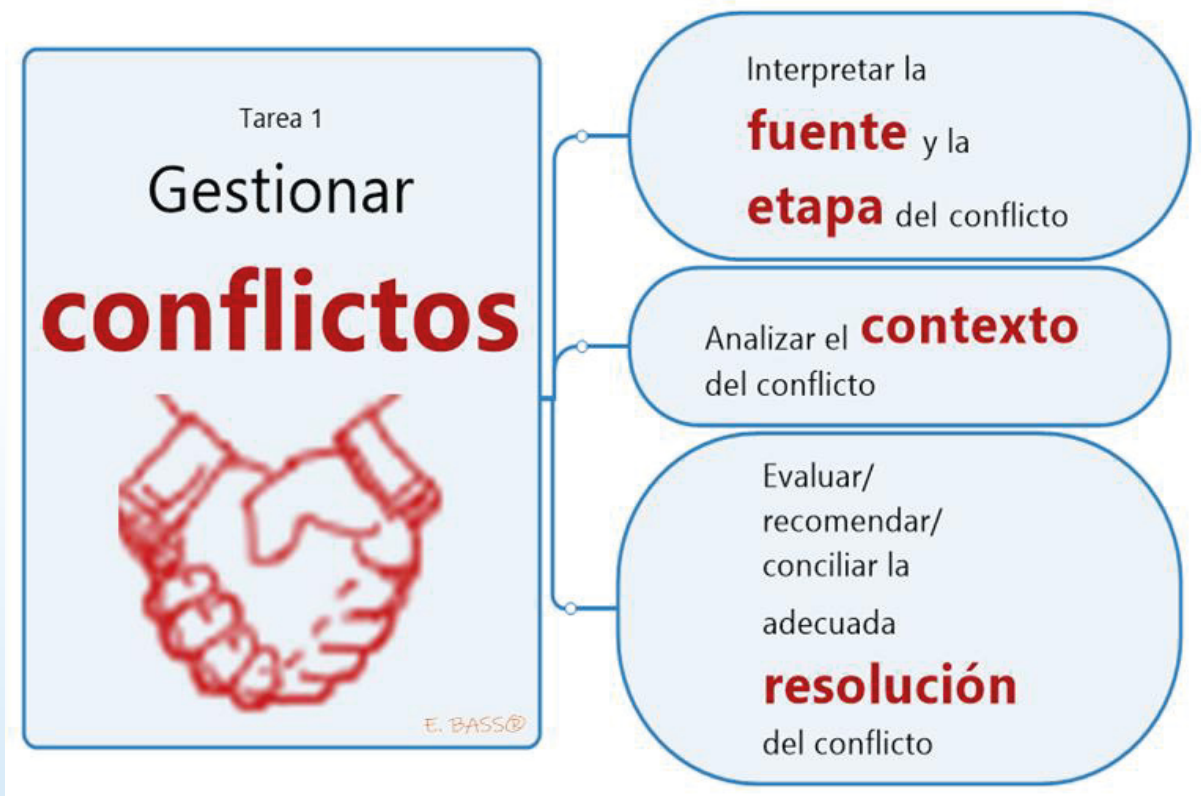
Gráfico 4: Área de Dominio I Personas, Tarea I / Gestionar Conflictos (Imagen: E. Bazo Safra, PMP, Mg.)

A manera de ejemplo, para la Tarea # 1, correspondiente al Dominio I “Personas” del Esquema de Contenido del Examen PMP (PMP Examination Content Outline), un practicante de proyectos debería ser capaz de gestionar los conflictos que existirán en un proyecto, interpretando la fuente y etapa en que se originan, analizando el contexto para encontrar y recomendar la solución más adecuada, tal como muestra la imagen adjunta.