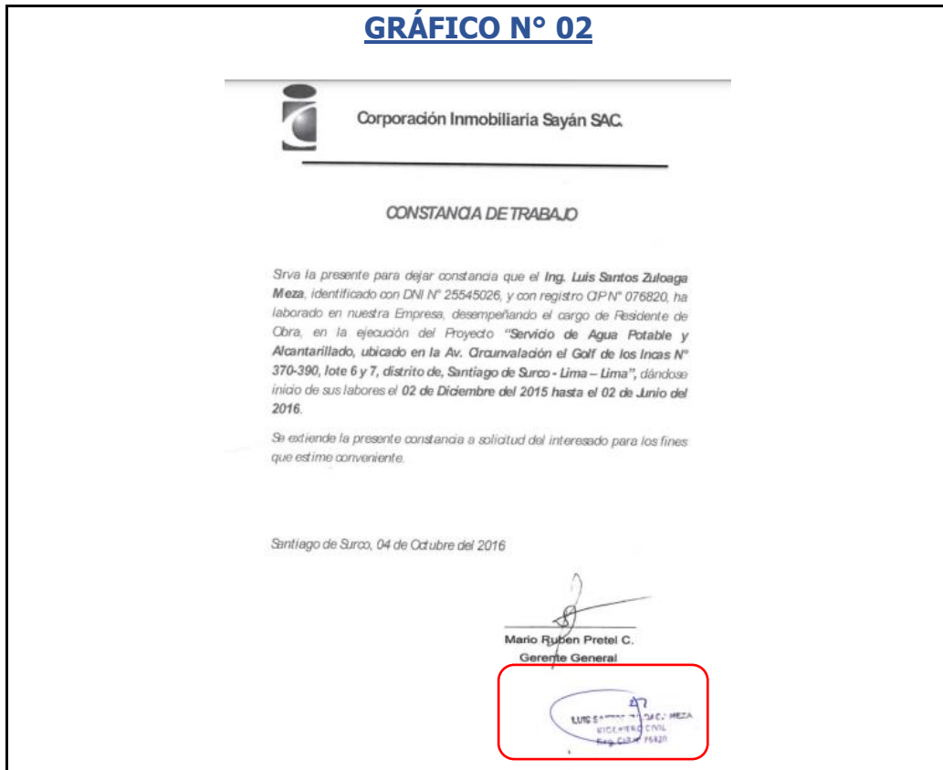
GRÁFICO N° 02