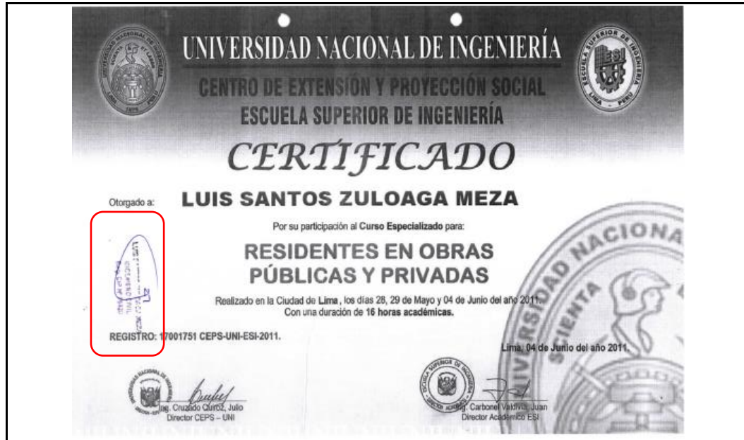
GRÁFICO N° 07