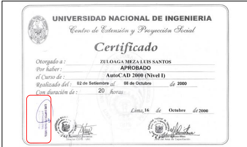
GRÁFICO N° 05