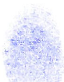
Huella dactilar (Índice derecho)