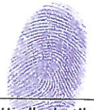
Huella dactilar (Índice derecho)